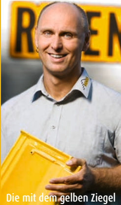
Die mit dem gelben Ziegel